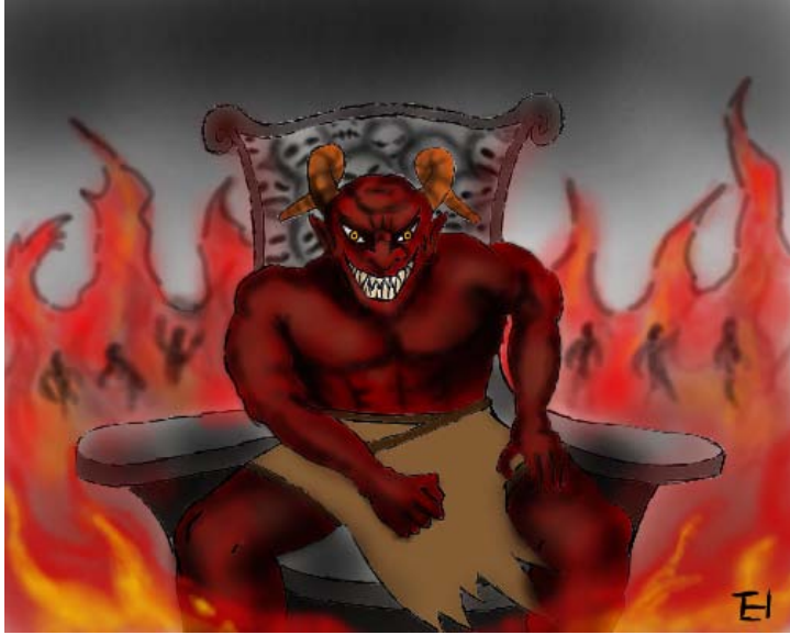
အပြစ်ဆိုတာ ပေးဆပ်ရစမြဲပါ။

ယောဟန် ၃:၃၆.၁ `သားတော်ကိုပယ်သောသူမူကား အသက်ကိုမတွေ့ရ။ ထိုသူ၏အပေါ်၌ ဘုရားသခင်၏ အမျက်တော် တည်နေသည်။´