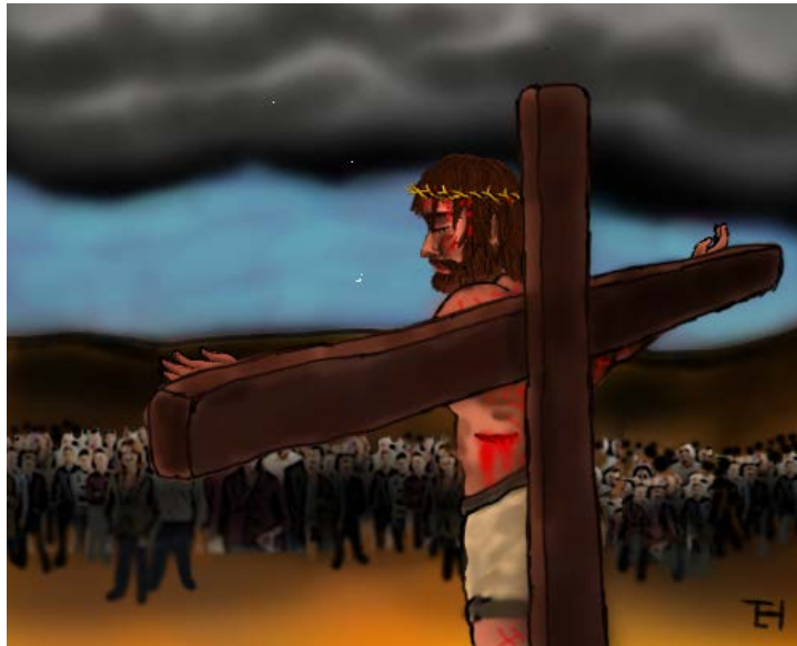
Christ died for sinners!

І Яхъя 4:10 Мәхәббәт менә шуннан гыйбарәт: без Аллаһыны яратканнан түгел, бәлки Ул безне яратты һәм безнең гүнаһларыбызны кичерелүен алып килүче һәм безне Аллаһы белән татулаштыручы корбан рәвешендә үзенең Улын һибәрде.