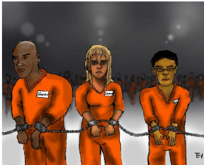
We are all sinners!

ພຣະທັມໂຢຮັນ 3:19 ນີ້ແຕ່ຫລະ, ແມ່ນການຕັດສິນລົງໂທດ ຄືວ່າຄວາມສວ່າງໄດ້ເຂົ້າມາໃນໂລກ ແຕ່ມະນຸດໄດ້ຮັບຄວາມມືດ ຫລາຍກວ່າຮັກຄວາມສວ່າງເພາະກິຈການຂອງເຂົາຊົ່ວ