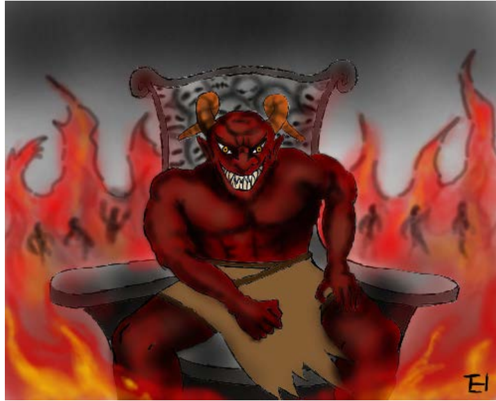
There is a cost for sin!

ພຣະທັມໂຍຮັນ 3:36 ຜູ້ທີ່ວາງໃຈໃນພຣະບູດກໍ່ມີຊີວິດຕະລອດໄປເປັນນິດ ຜູ້ທີ່ບໍ່ເຊື່ອຟັງພຣະບູດກໍ່ຈະບໍ່ໄດ້ເຫັນຊີວິດ ແຕ່ພຣະພິໄຣດຂອງພຣະເຈົ້າບົກຄຸມຢູ່ເທິງຜູ້ນັ້ນ