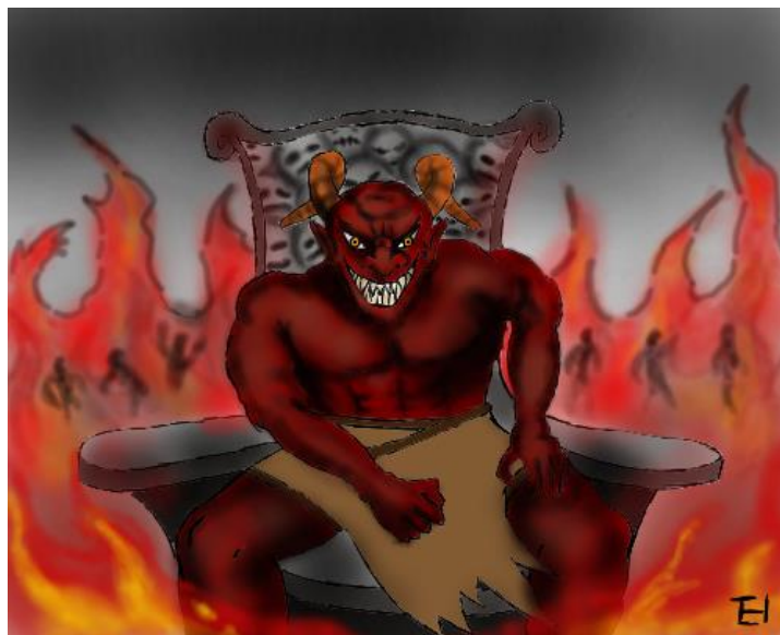
There is a cost for sin!

យ៉ូហាន 3:36 ៣៦ អ្នកណាជឿលើព្រះបុត្រា អ្នកនោះមានជីវិតអស់កល្បជានិច្ច។ អ្នកណាមិនព្រមជឿលើព្រះបុត្រា អ្នកនោះមិនបានទទួលជីវិតឡើយ គឺគេត្រូវទទួលទោសពីព្រះជាម្ចាស់»។