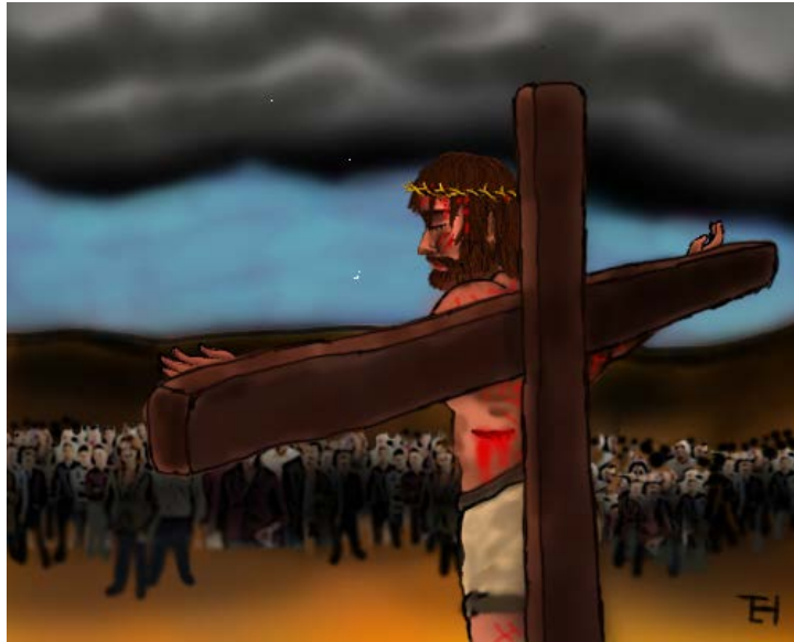
Christ died for sinners!

I John 4:10 Tu meh pengerindu, ukai reti nya kitai udah rinduka Allah Taala, tang Iya udah rinduka kitai, lalu udah ngirumka Anak Iya nyadika piring kena muai dosa kitai.